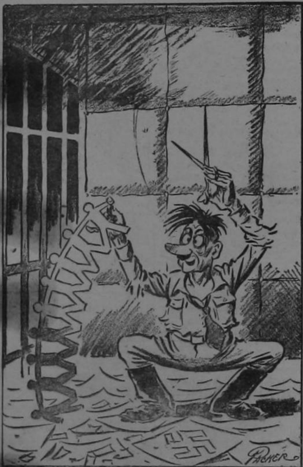
"El trabajo a que tengo que dedicarme no me permite abandonar mi Cuartel General ni siquiera por unos días..."—Hitler.

La filosofía es la habilidad de explicar por qué se es feliz a pes- de ser pobre.