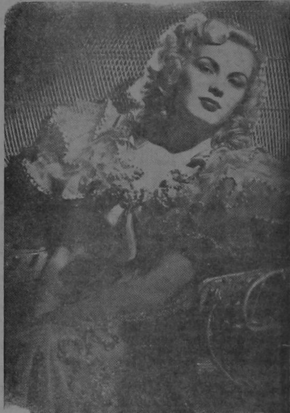
Nodrizza muy competente. Tra bajó en casa de un sacerdote. Ofrece sus servicios a niños y ancianos. A los que tengan dientes, les cobra extra.

"Los pantalones eran muy confianzudos: había que tenerlos a raya."