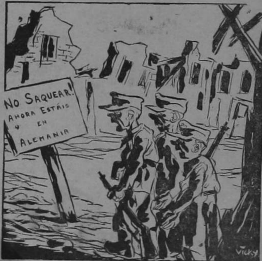
EL FIN DE LA JORNADA

vamos. En Costa Rica la situación no puede ser peor. Ya hay hambre en muchos hogares. El gobierno no se anima a enfrentarse al comercio que es el único que ha hecho clavos de oro en esta crisis. Los niños glostoras hablan doctoralmente de componer el país. Los camaradas hasta el momento no han sembrado un chayote. La crisis es completa. Dentro de poco, a como van las cosas, nos convertiremos en canibales. Pilón gordito que pase a nuestro lado, es pilón gordito a quien le empujamos su mordizco. No habrá otro remedio.