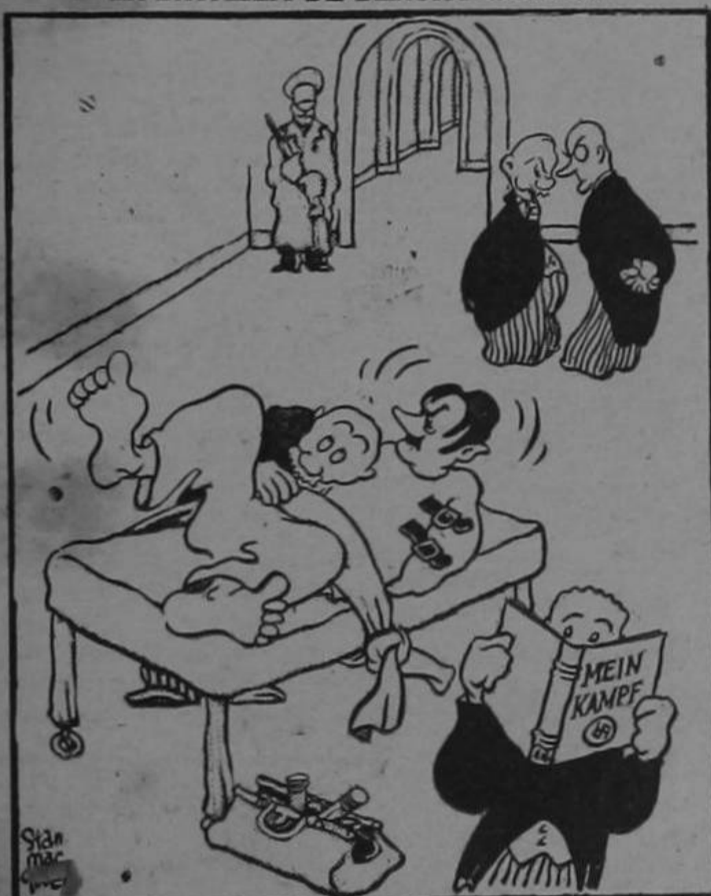
(Se reciben noticias de que Hitler se halla bajo el cuidado de cuatro médicos)