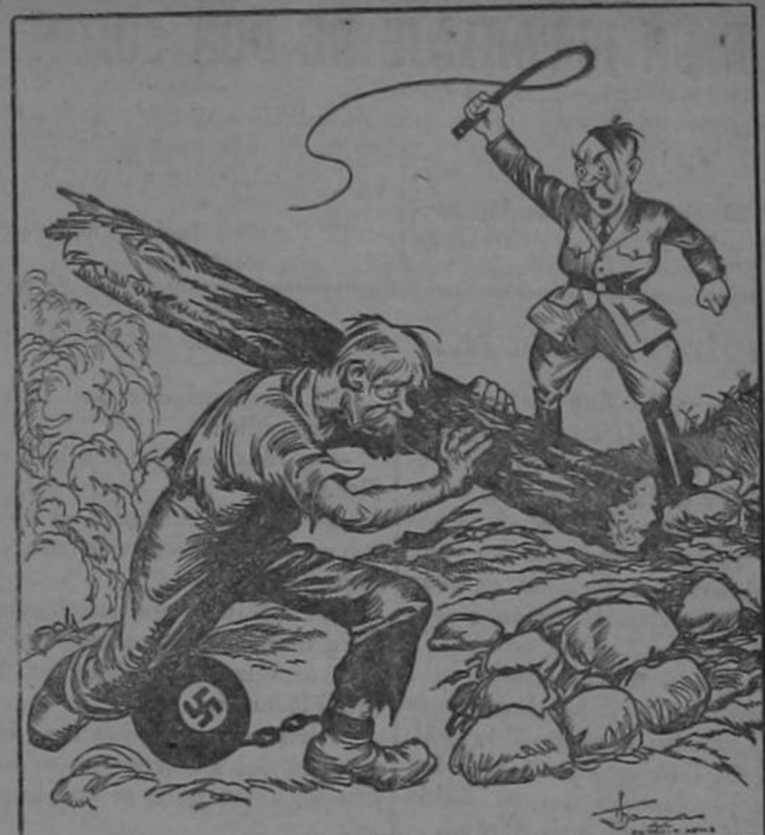
Hitler: "Que quieres llegar a ser, un esclavo de los aliados?"